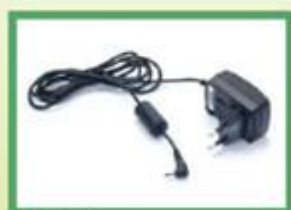
Caricatore da muro