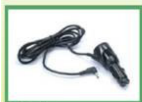
Caricatore da auto

28 indispensabili ed economiche piccole aree per permettere a tutti di provare l'emozione di un viaggio con MyNav.