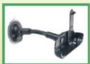
Supporto da auto